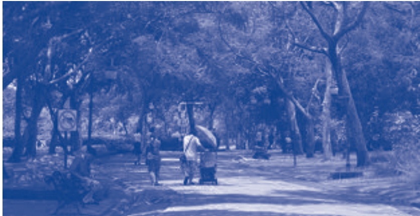
ภาพสวนสาธารณะ