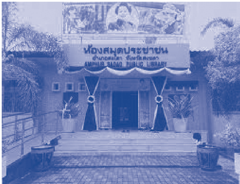
ภาพห้องสมุดประชาชน